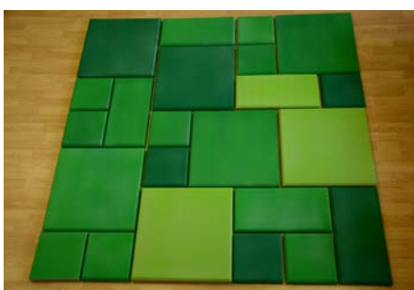
Окрашенные панели ЭхоКор