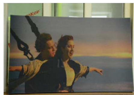
Фотопечать на панелях ЭхоКор